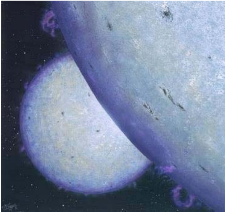
Concepción artística de la estrella binaria DI Herculis, formada por dos estrellas muy jóvenes (4,5 millones de años; en comparación, el Sol tiene 5.000 millones de años), cinco veces más masivas y unas cincuenta veces más luminosas que el Sol.